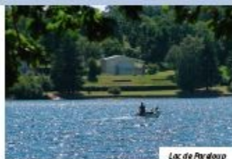
Lac de Pareloup