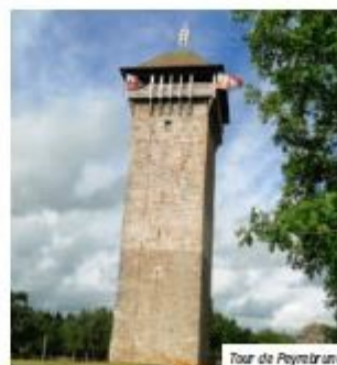
Tour de Peyrebrune